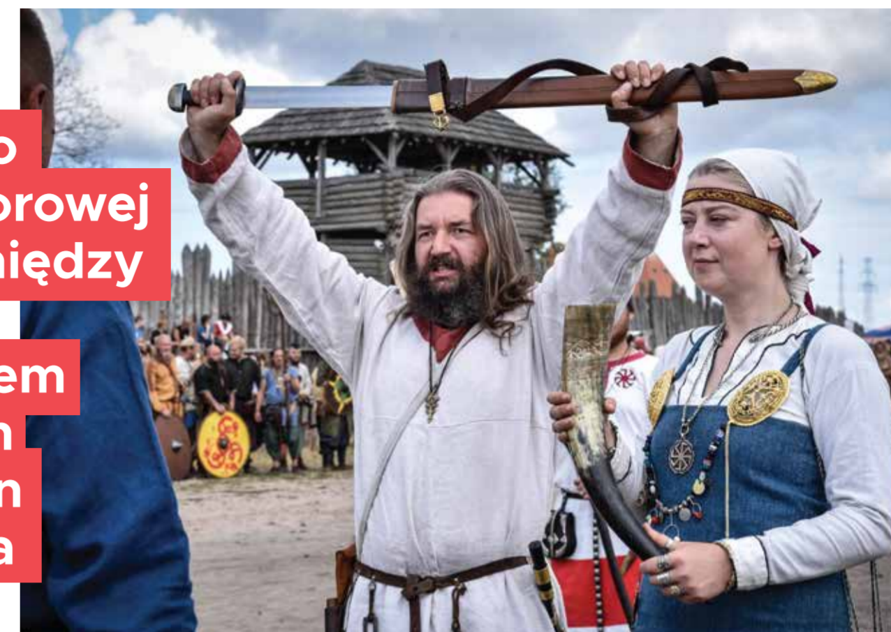
25. Festiwal Słowian i Wikingów 2019