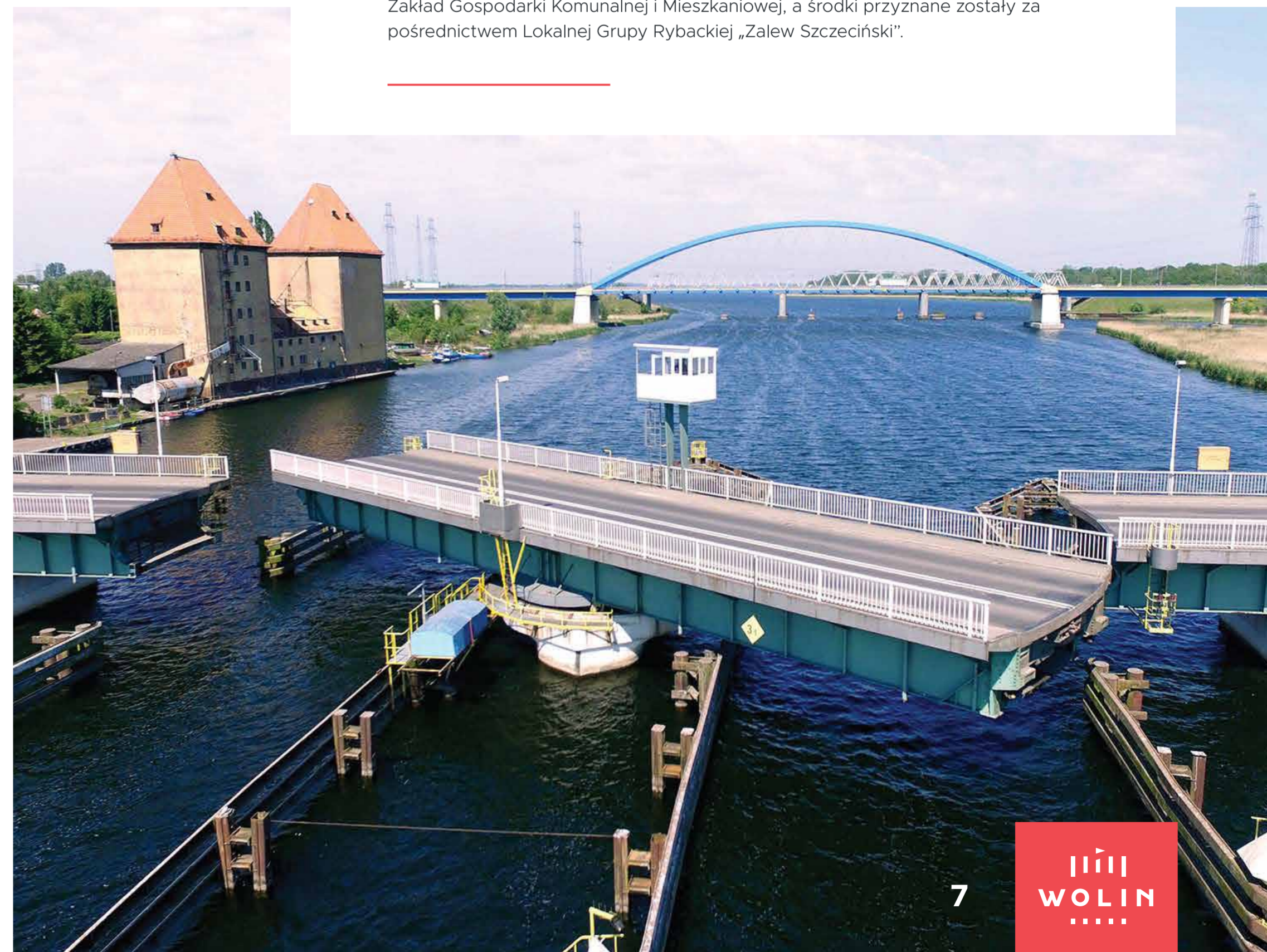
Most obrotowy w Wolinie

Niestety, wiele z jego elementów odpowiedzialnych za mechanikę oraz ogólny wygląd zostały przez lata bardzo mocno zużyte. Na szczęście z pomocą kolejny raz przychodzą środki zewnętrzne, a konkretnie zdobyte w tym roku dofinansowanie w wysokości 230 000 zł. Cała inwestycja opiewa na kwotę blisko 420 tys. zł. Remont obejmie wykonanie projektu i montaż szaf sterowniczych – kluczowe elementy odpowiedzialne za sterowanie mechanizmem obrotowym mostu. Wymieniona zostanie obecna sygnalizacja drogowa i szlabany. Uzupełnione zostaną oznakowania na samym moście. Poza tym, zainstalowane zostaną zapory typu U-13a (4 sztuki), sygnalizatory dwukomorowe (2 sztuki) i pionowe znaki drogowe (11 sztuk). Wykonane zostanie również oznakowanie poziome jezdni na długości ok. 206 metrów. Wnioskodawcą pozytywnie rozpatrzonego wniosku o dofinansowanie jest Zakład Gospodarki Komunalnej i Mieszkaniowej, a środki przyznane zostały za pośrednictwem Lokalnej Grupy Rybackiej „Zalew Szczeciński”.