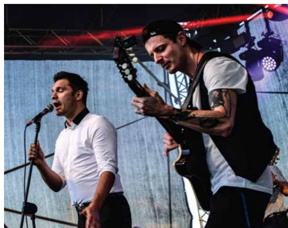
Zespół Nazwa

Podczas Jarmarku można było skosztować średniowiecznych i terażniejszych wypieków, wziąć udział w zabawach i konkursach dla najmłodszych, obejrzeć niesamowite widowiska i posłuchać koncertów różnych gatunków muzyki. Wielkim zainteresowaniem cieszył się Festiwal Zapasów dzieci w Stylu Wolnym pod okiem Mistrza Olimpijskiego Andrzeja Suprona i koncert Marcina Wyrostka, zwycięzcy polskiej edycji programu „Mam Talent”, który podczas koncertu w naszej gminie występował wraz z zespołem Corazon.